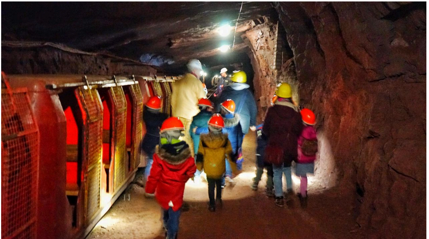
Kleines Bergwerk