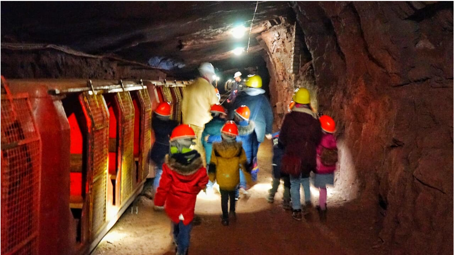
Kleines Bergwerk