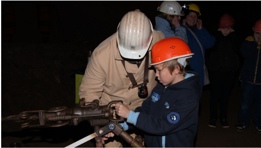
Besucherbergwerk Kleinenbremen Kinderführung