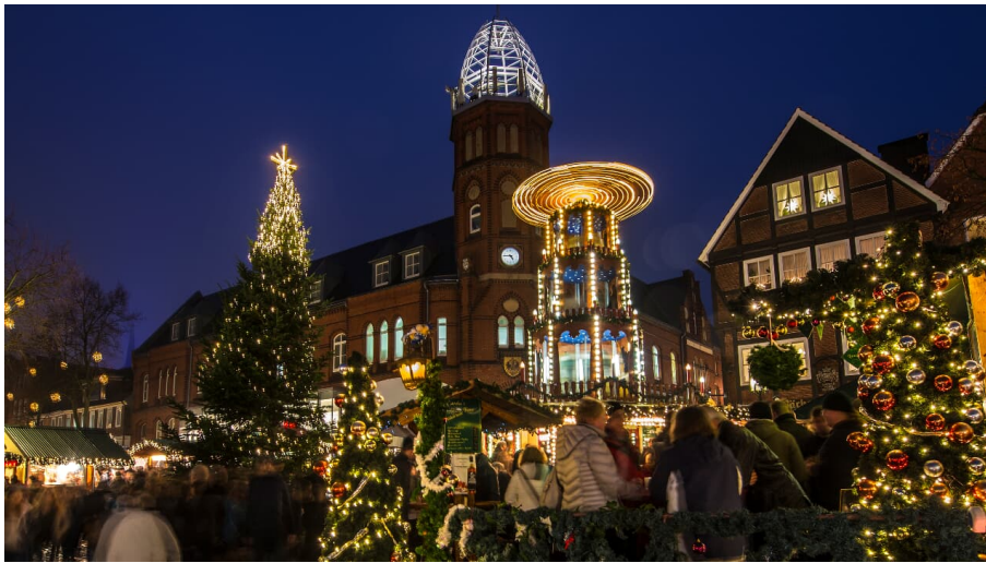
Stade Kunsthandwerkermarkt Mittelalter Weihnachtszeit_ELS_0490101216a.jpg