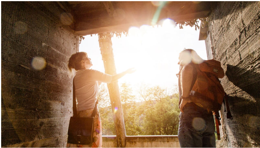
Auf den Spuren des weißen Goldes.jpg