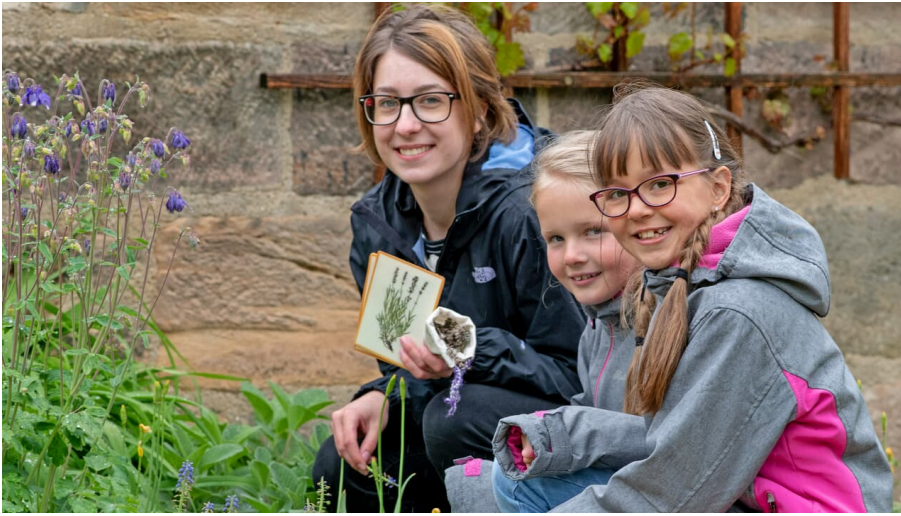
Düfte des Mittelalters.jpg