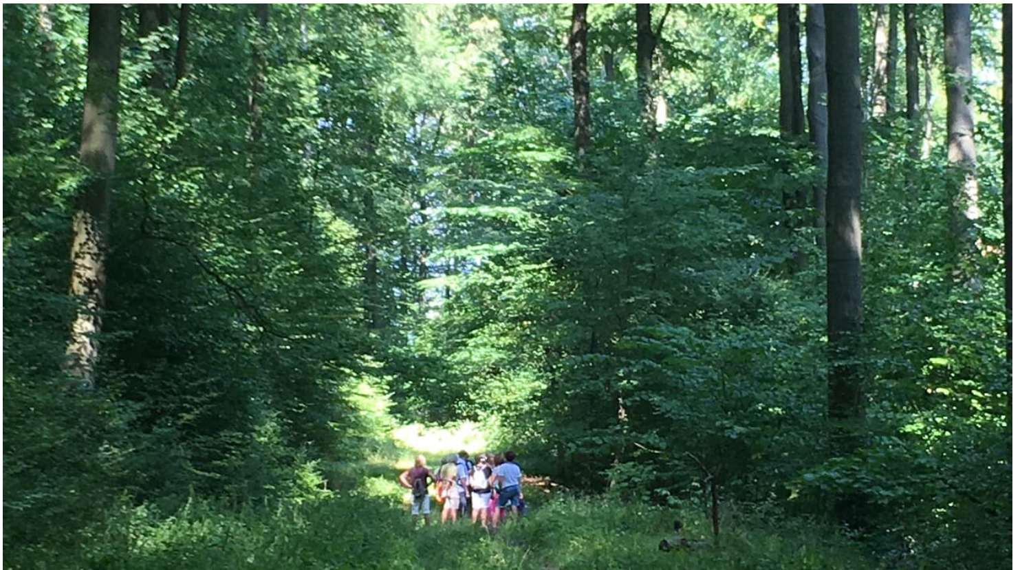
Geführte Wanderung in Bad Driburg

Samstag, 18.05.2024, 14:00 - 17:00 Uhr Mittwoch, 26.06.2024, 14:00 - 17:00 Uhr Samstag, 03.08.2024, 14:00 - 17:00 Uhr Samstag, 07.09.2024, 14:00 - 17:00 Uhr Samstag, 12.10.2024, 14:00 - 17:00 Uhr Samstag, 23.11.2024, 14:00 - 17:00 Uhr