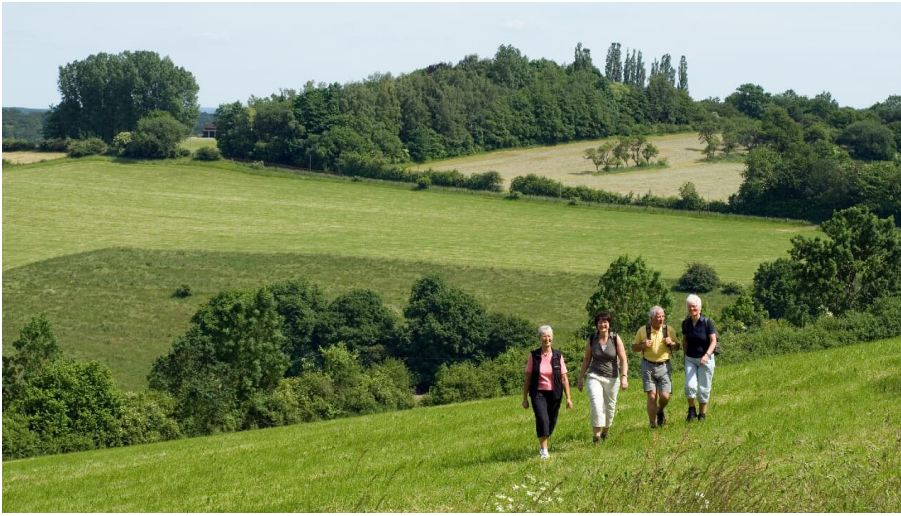
Geführte Wanderung in Bad Driburg