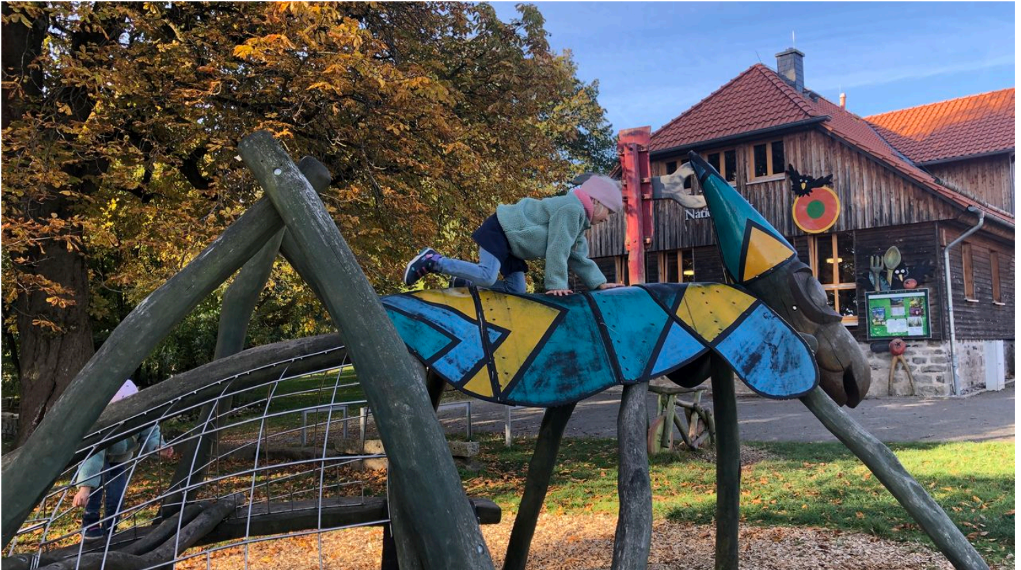
Kinder Hohnehof Herbst.JPG