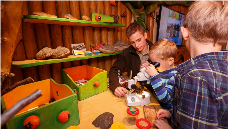
4805 - Ranger-Tag im Natur-Erlebniszentrum HohneHof bei Drei Annen Hohne Ranger Day at the HohneHof Nature Experience Centre near Drei Annen Hohne in the Harz Mountain.jpg