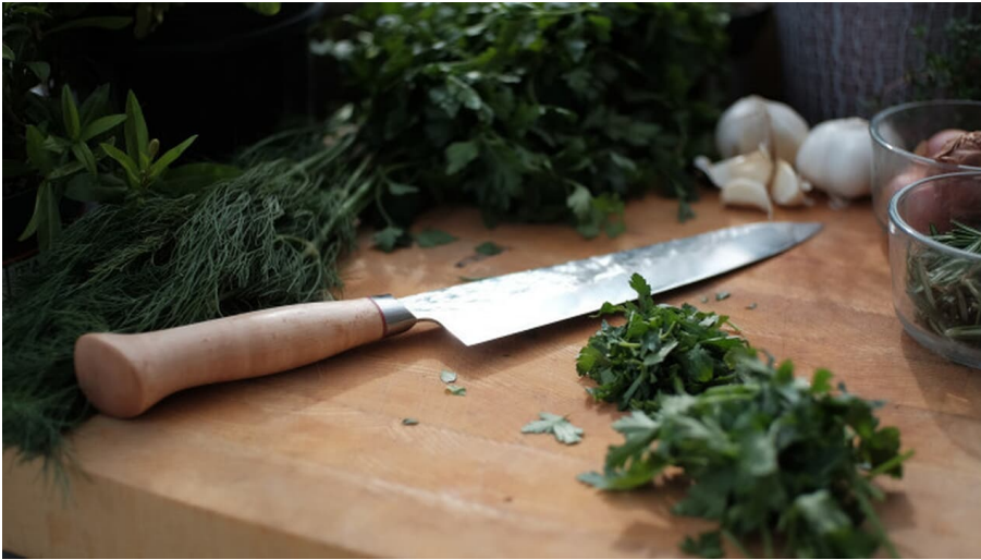
Wein & Kräuter.jpg