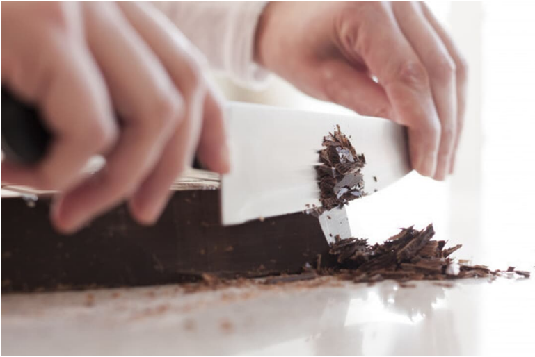
Wein & Schokolade.jpg