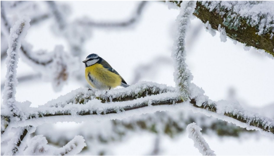
Wintervogel, Infozentrum Kaltenbronn