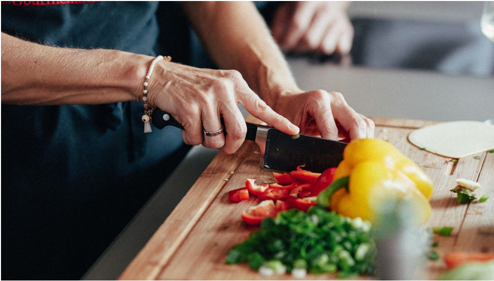
AldeGott 10 21 peterbender 90

Link zum Kartenverkauf ( https://www.gourmet-die-kochschule.de/ )