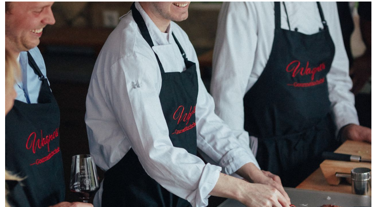
AldeGott 10 21 peterbender 125