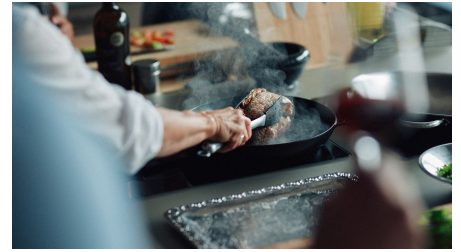
AldeGott 10 21 peterbender 106 1