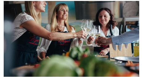
AldeGott 10 21 peterbender 93