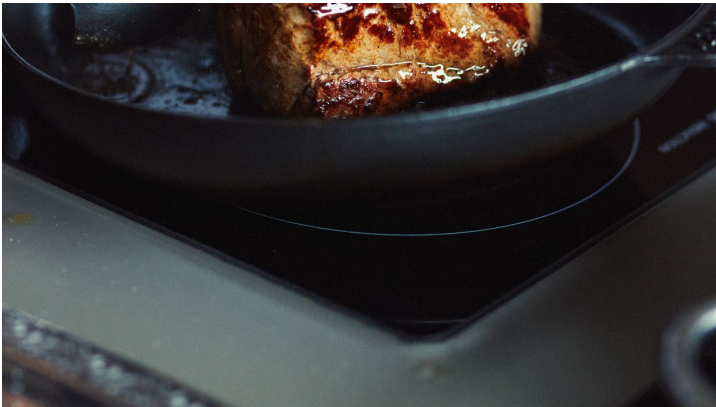
AldeGott 10 21 peterbender 121