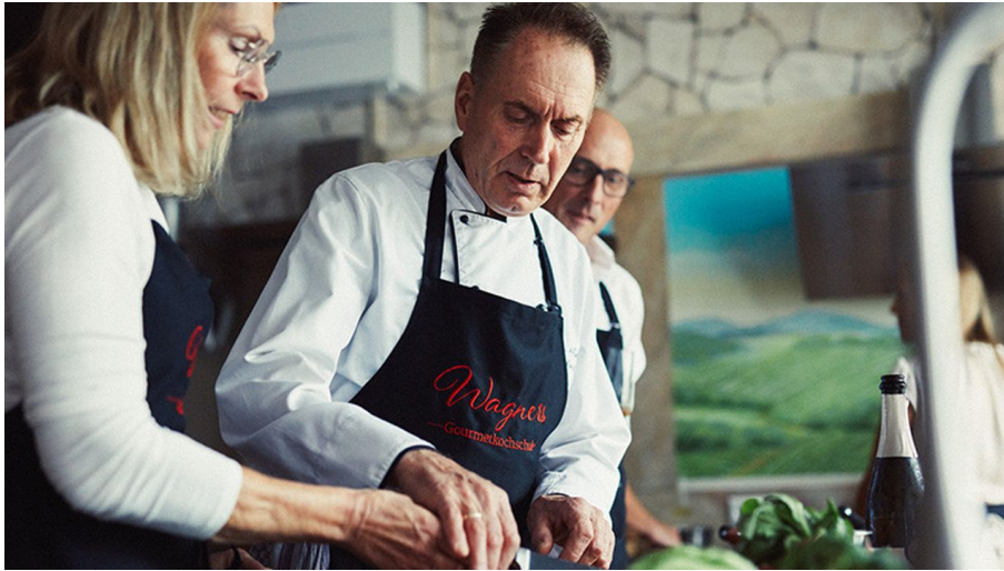
AldeGott 10 21 peterbender 72 WEB