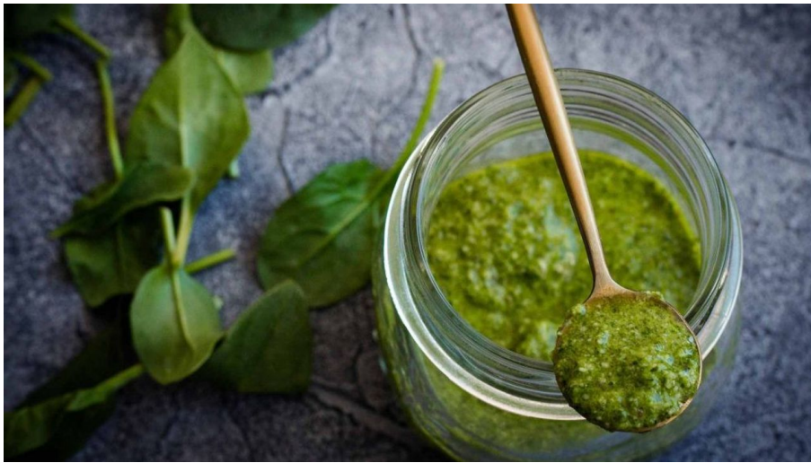
Wildkräuter und Pesto