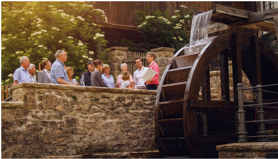
Historische Stadtführung