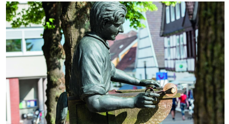
Glasmacherdenkmal in Bad Driburg