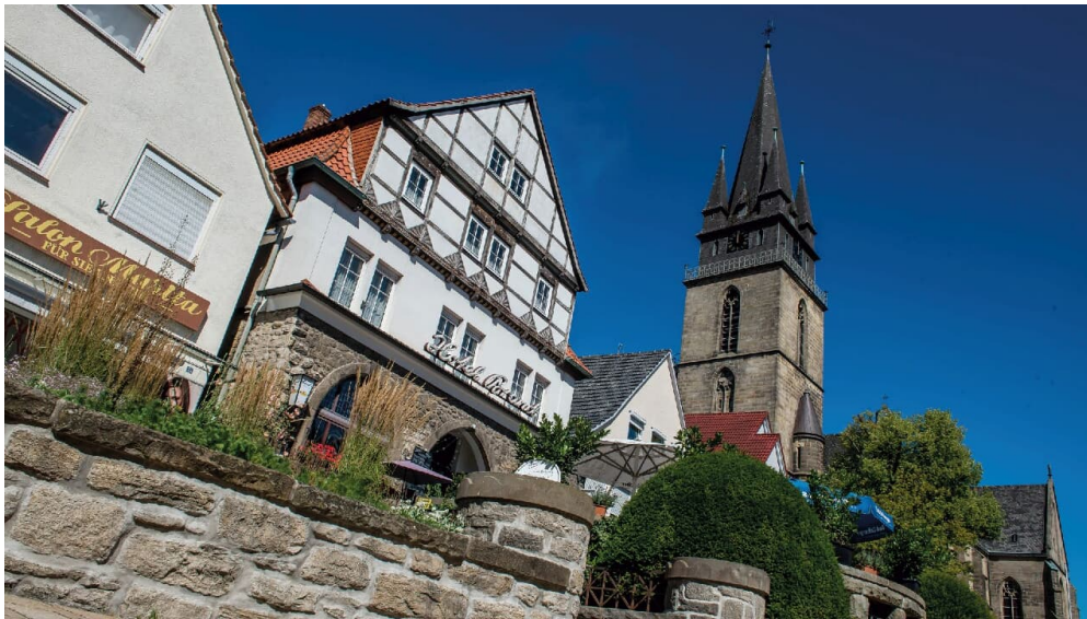
Historische Stadtführung

Freitag, 01.03.2024, 14:00 - 16:00 Uhr Freitag, 15.03.2024, 14:00 - 16:00 Uhr Sonntag, 31.03.2024, 10:00 - 12:00 Uhr Freitag, 05.04.2024, 14:00 - 16:00 Uhr Freitag, 12.04.2024, 14:00 - 16:00 Uhr Freitag, 19.04.2024, 14:00 - 16:00 Uhr Freitag, 26.04.2024, 14:00 - 16:00 Uhr