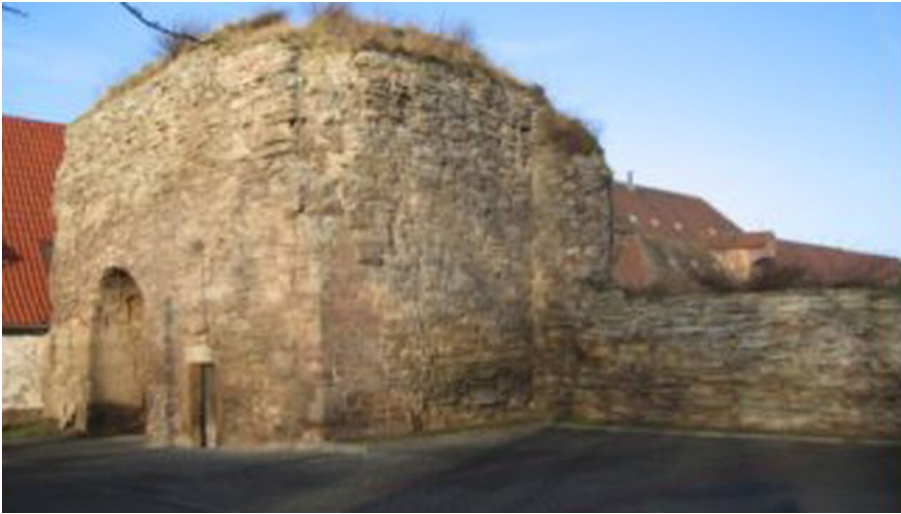
kaisertor_rahmenlos.jpg - © Kloster und Kaiserpfalz Memleben