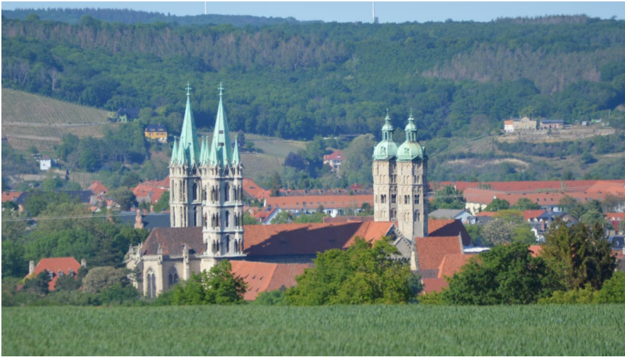
Blick auf Dom - © Stadt Naumburg (Saale), SG Kultur