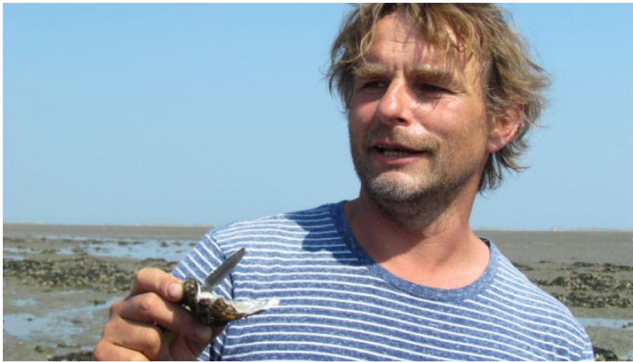
Veranstaltungen-Wangerland-Wattwanderung-Gerke Ennen.jpg