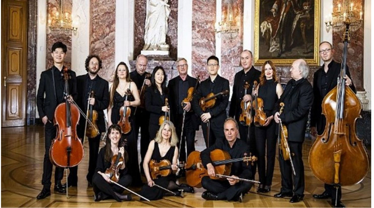
Kurpfälzisches Kammerorchester Mannheim