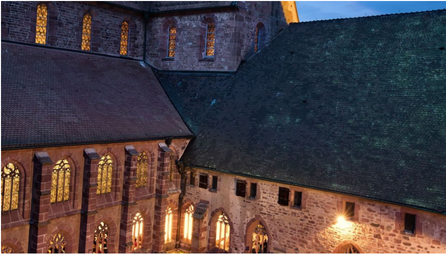
Matthias Zizelmann Kreuzgangkonzert 2018