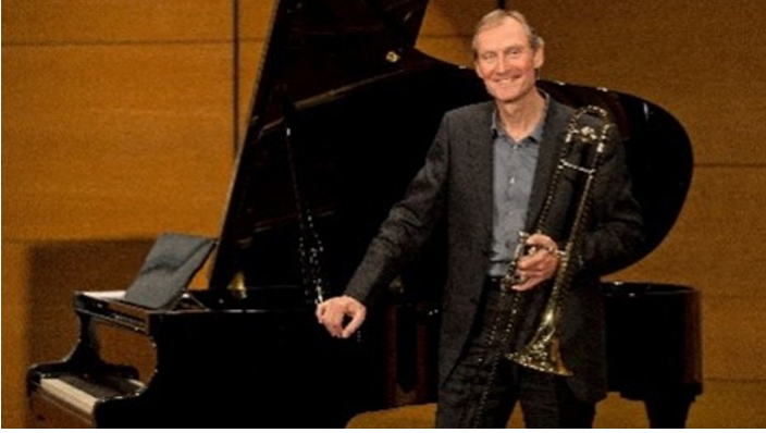
Uli Gutscher - © Uli Gutscher