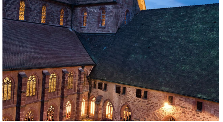
Matthias Zizelmann Kreuzgangkonzert 2018