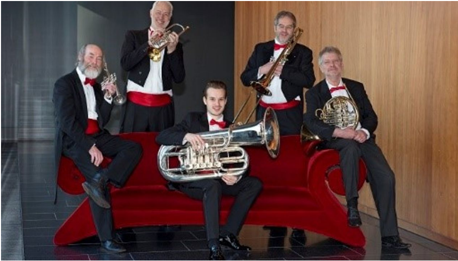
Ludwigsburger Blechbläser Quintett

Genießen Sie die Klänge des Ludwigsburger Blechbläser Quintetts & des Uli Gutscher Trios in der einzigartigen Kulisse der Alpirsbacher Klosterkirche.