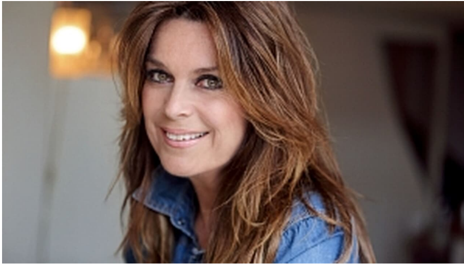
ABBA macht glücklich