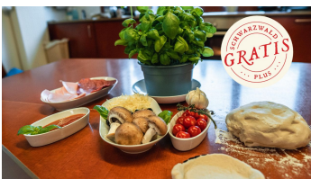
Zutaten für die Pizza