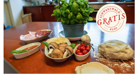
Zutaten für die Pizza - © Bayersbronn Touristik/Max Günter