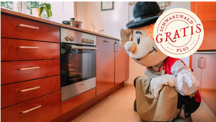
Murgel backt - © Bayersbronn Touristik/Max Günter