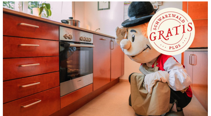
Murgel backt