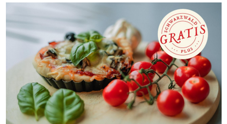
Wir backen Pizza