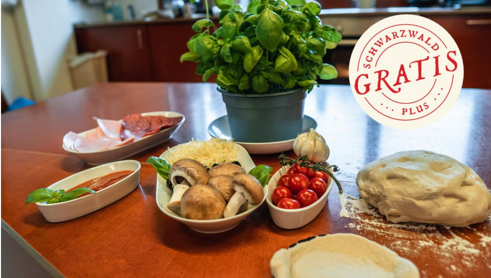
Zutaten für die Pizza - © Bayersbronn Touristik/Max Günter