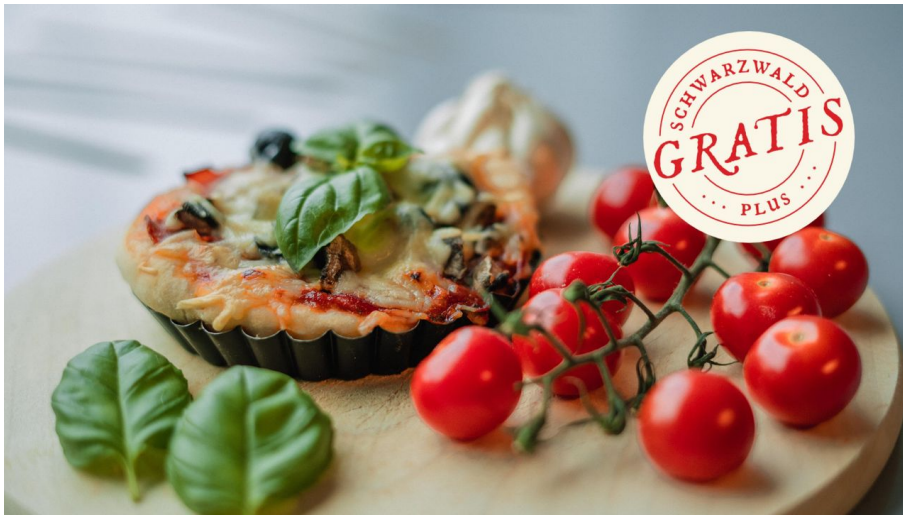
Wir backen Pizza