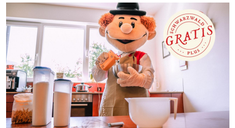
Murgel backt