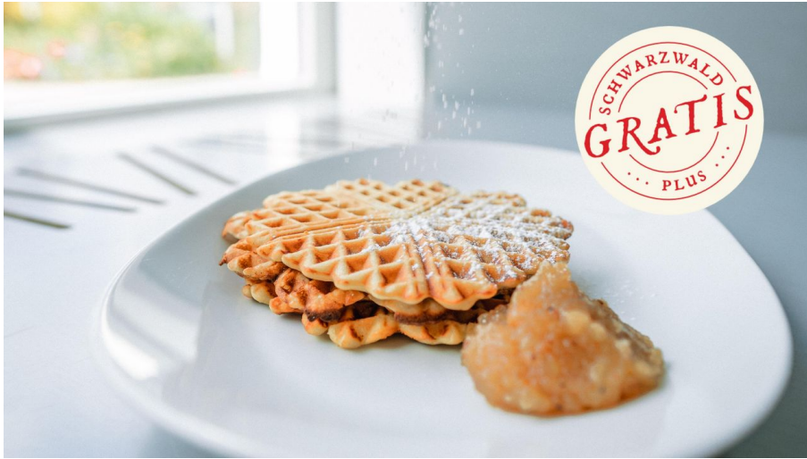
Waffeln und Apfelmus