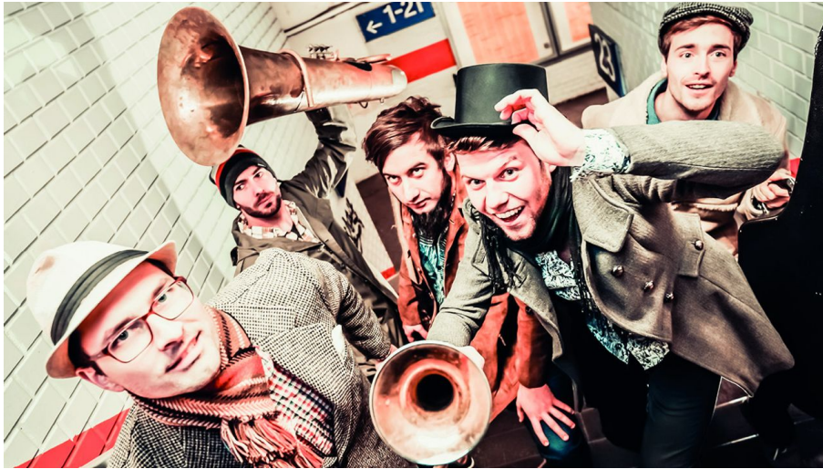
Maik Mondial Vorschaubilder converted4