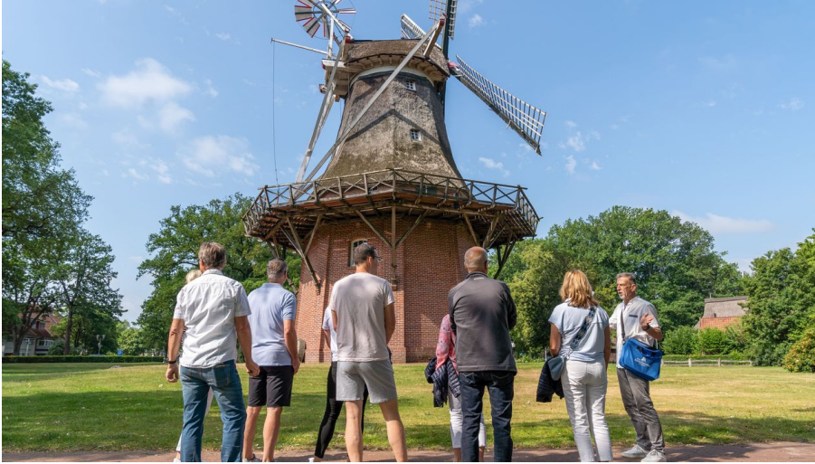
mühle.jpg