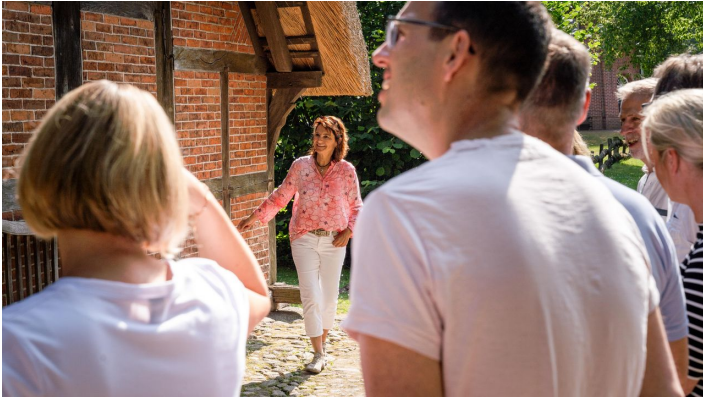
Gästekführungen.jpg - - info@bad-zwischenahn-touristik.de

Link zum Kartenverkauf ( https://www.bad-zwischenahn-touristik.de/freizeit/shop/erlebnisse/DE4/3fa308db-acde-43c8-935d-57170e71ae34/ortsspaziergang?useDetailSearch=false )