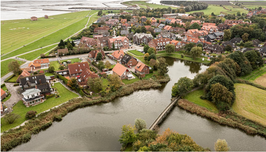
POI-Kolk-Horumersiel-Oliver Franke.jpg