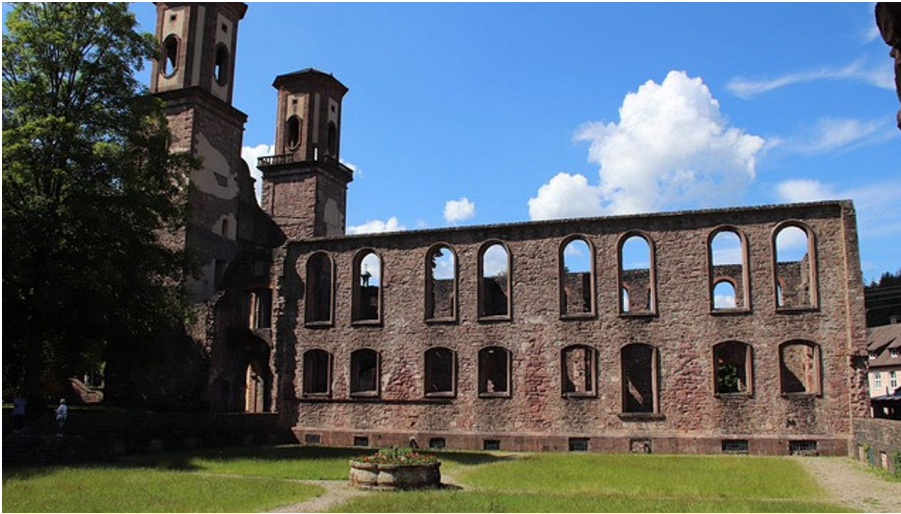
monastery ruin g138409dcc 640