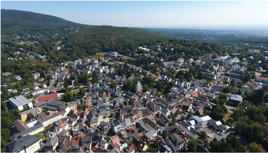
Königstein - von oben