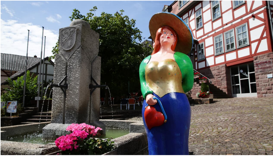
Rathausplatz mit Kurbotschafterin Bella