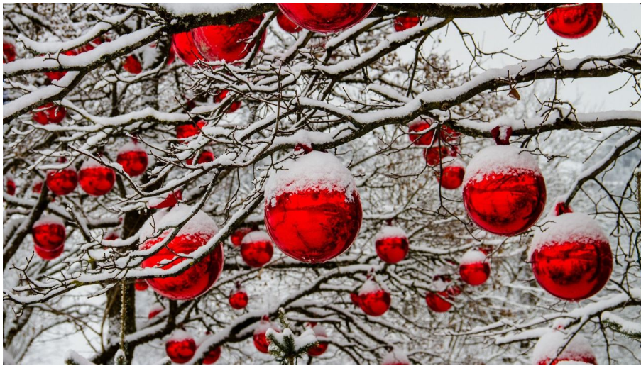
christmas-3009720_1920 c) 5598375-pixabay.jpg