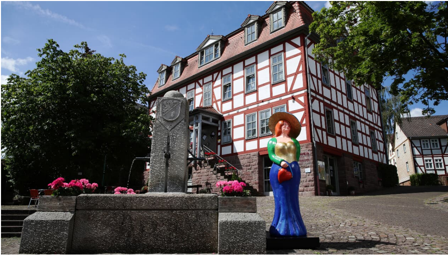
Bella in Bad Zwesten