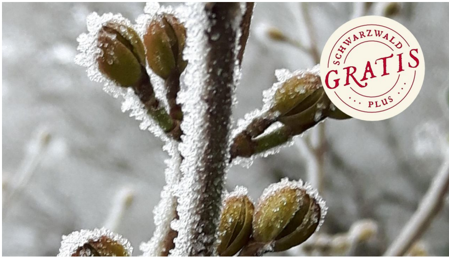
Kleine Knospenkunde - © Baiersbronn Touristik/Angelika Heitz