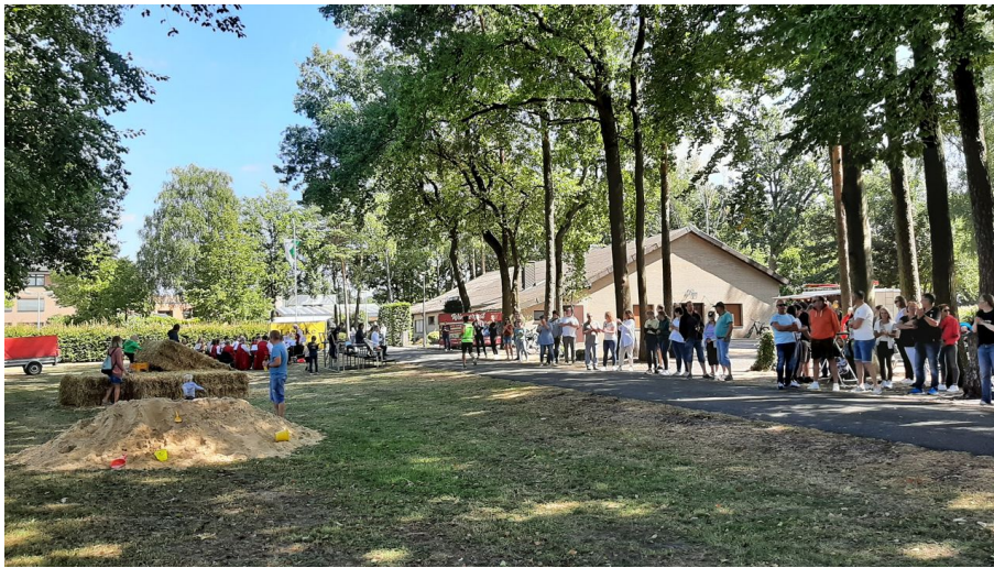
Grafschaftslauf '22 Liemke