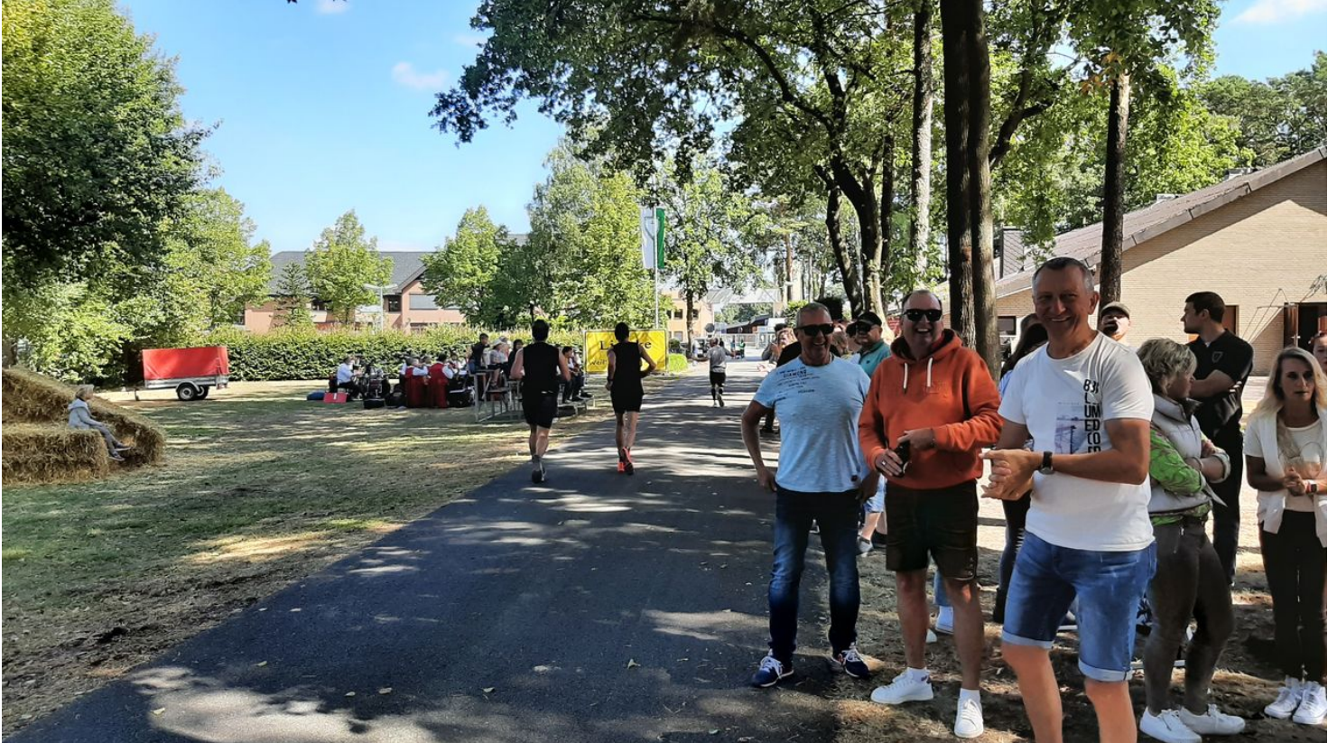
Grafschaftslauf 2022 von Rietberg über Verl nach Schloß Holte-Stukenbrock