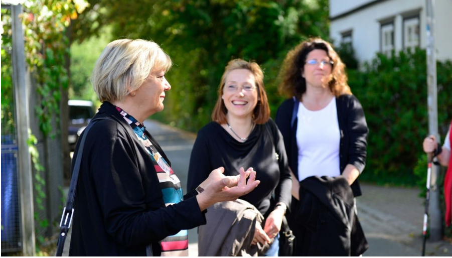
Stadtführung_Gifhorn_CC0 FB_8000413