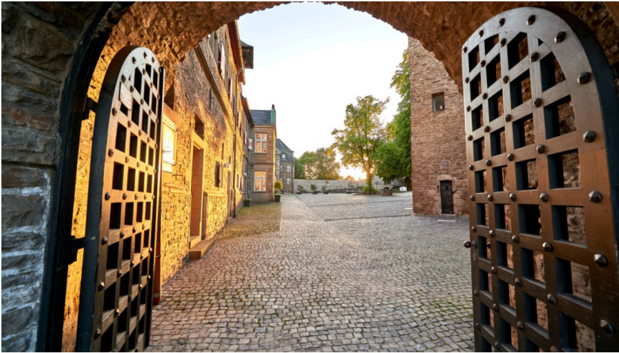
Toreingang zum Schloß Broich