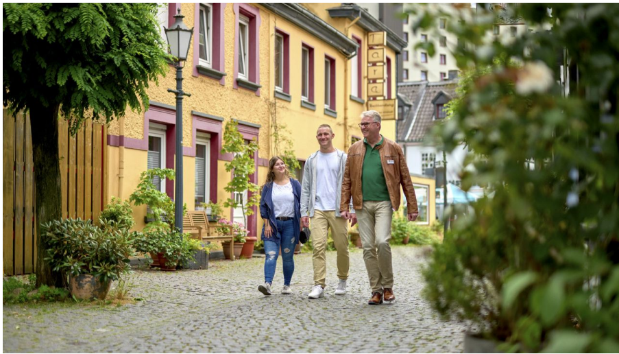
Mülheim entdecken