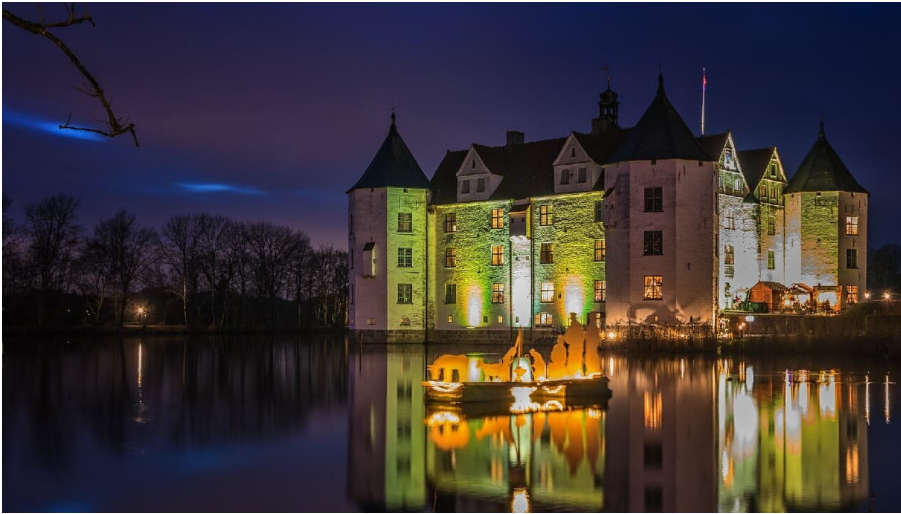
Märchenweihnacht auf Schloss Glücksburg