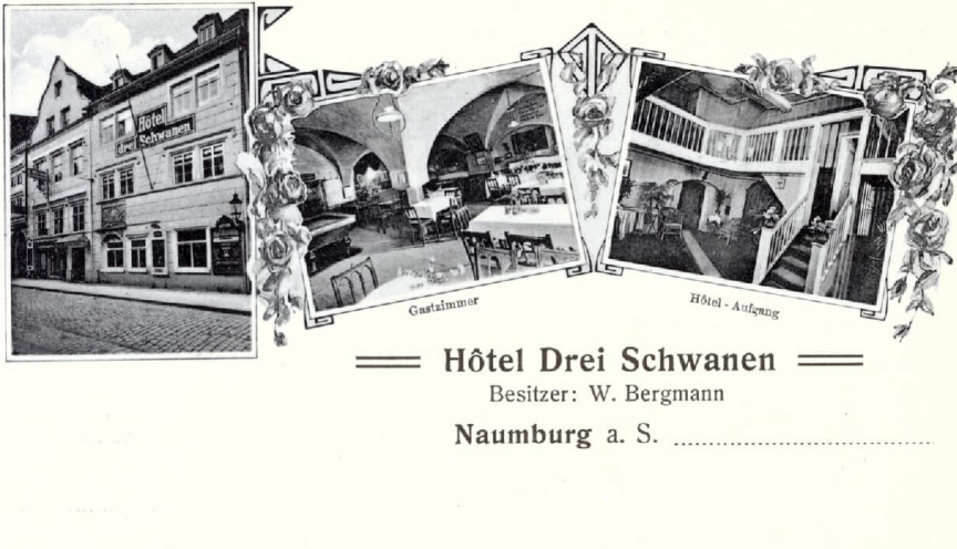
Zu den Drei Schwanen.jpg