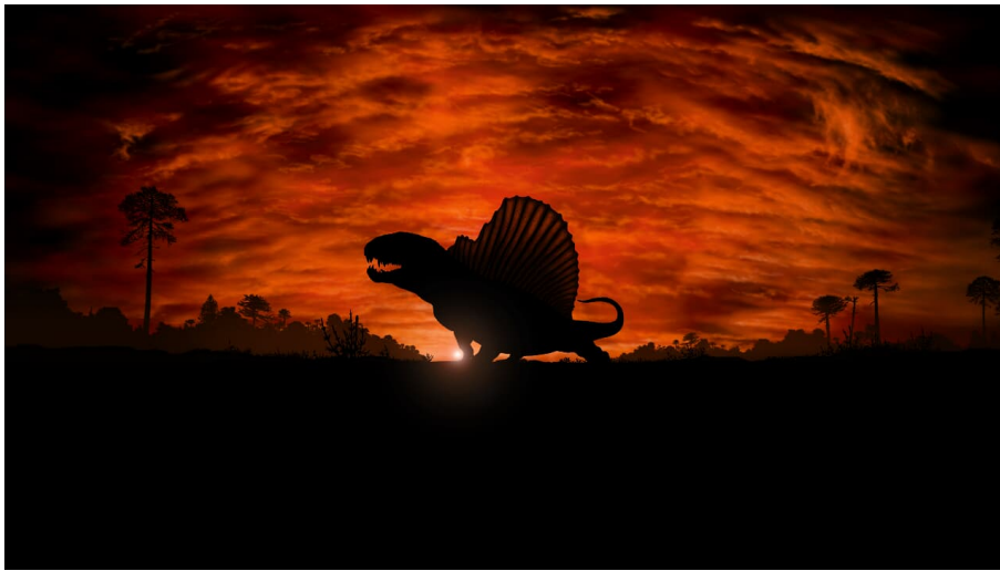
Permische Monster

Vor etwa 290 Millionen Jahren – im Zeitalter des Perms – beherrschten bizarre Tiere das Festland und die Gewässer des riesigen Urkontinents Pangäa. Die einzigartige Sonderausstellung "Permische Monster. Leben vor den Dinosauriern" entführt uns in die Zeit vor dem größten Artensterben der Erdgeschichte, lange vor dem Zeitalter der Dinosaurier.