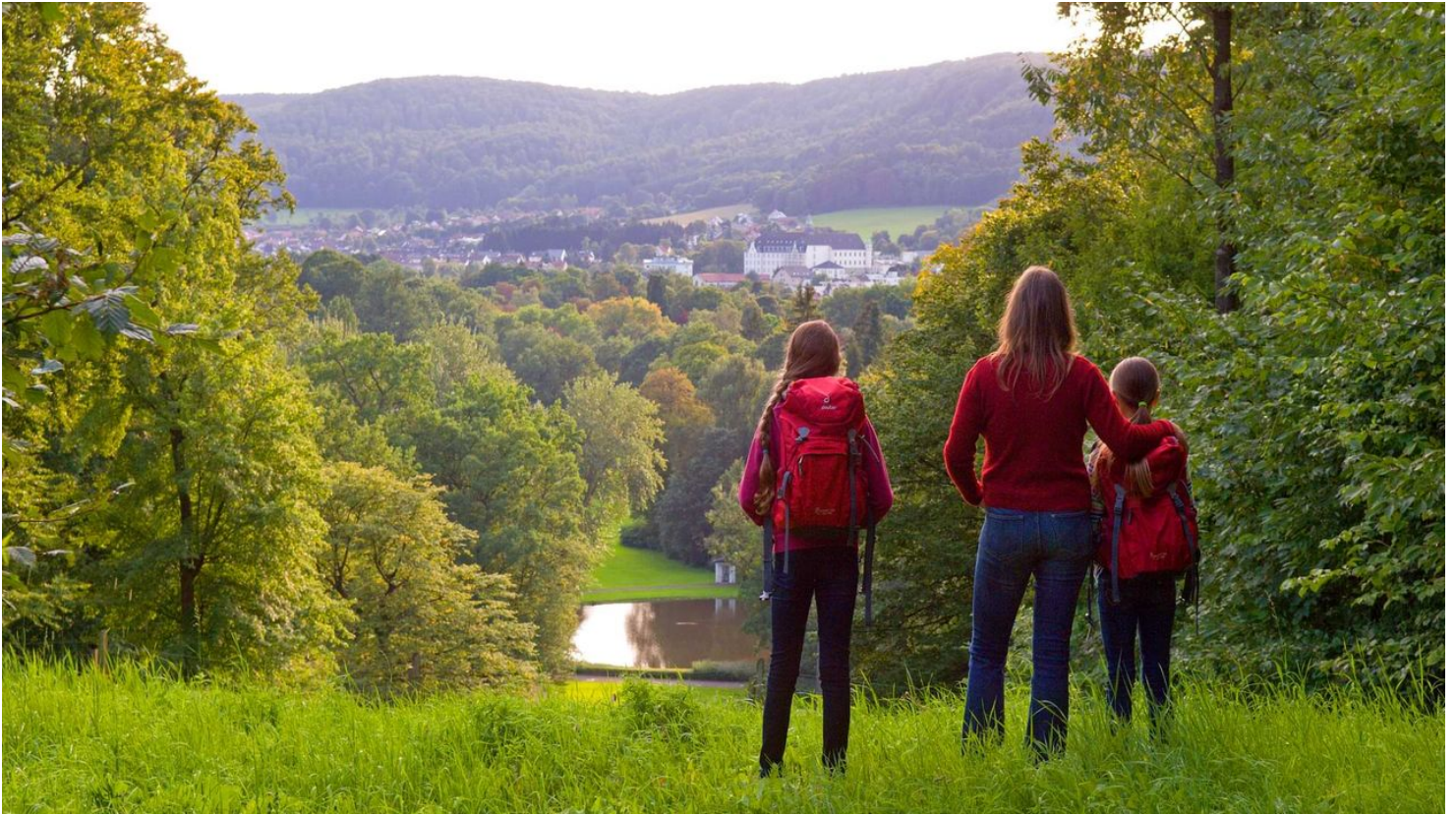
Bad-Driburg_Wanderer blicken auf den Gräflichen Park.jpg