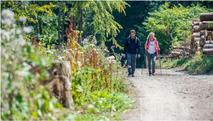
Geführte Wanderung