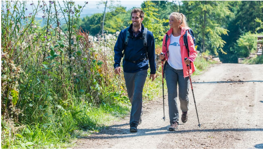
Geführte Wanderung