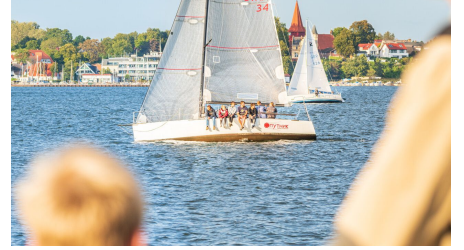
Mittwochsregatta 4