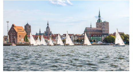
Mittwochsregatta 2