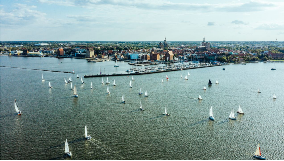
Mittwochsregatta 1 - © TMV/Gänsicke