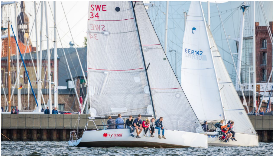
Mittwochsregatta 3