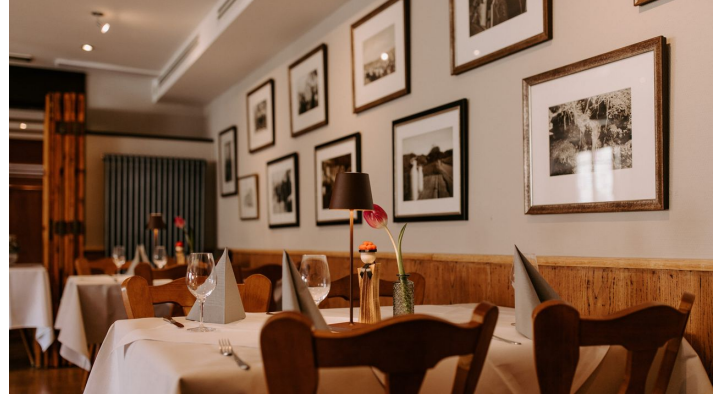
Neues Bild Linde 3