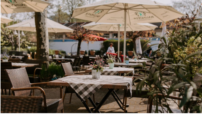
Neues Bild Linde 1

Facebook ( http://www.facebook.com/LindeDurbach/ )