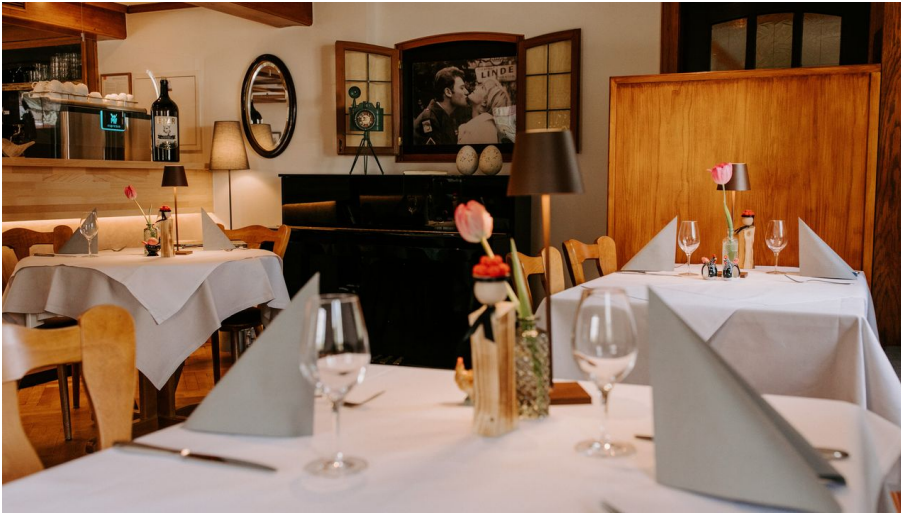
Neues Bild Linde