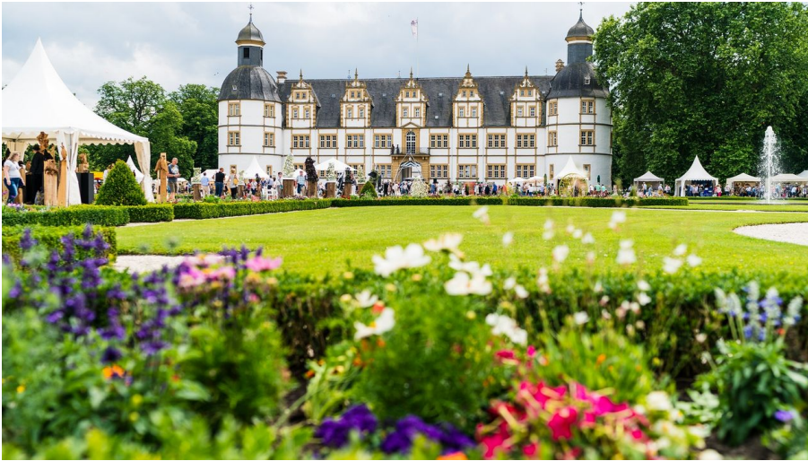
SchlossSommer | Schloss- und Auenpark