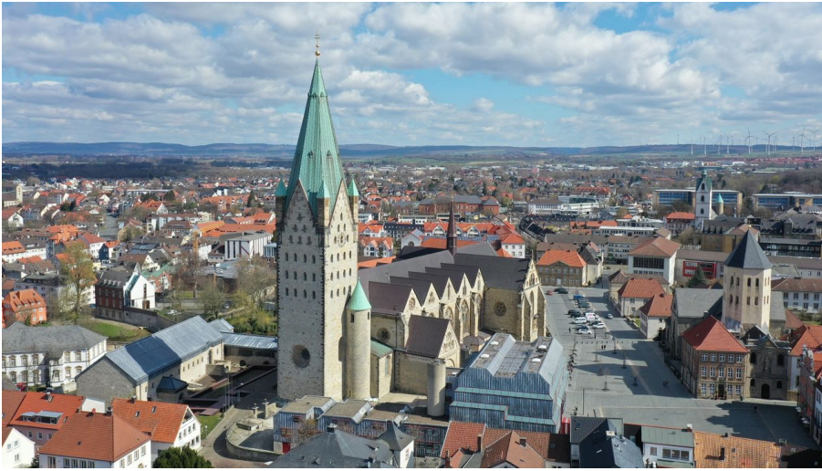
Blick auf den Dom von Westen