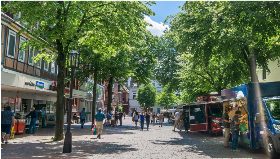
Stader Wochenmarkt

Tradition, Brauchtum, Volksfest sonstige