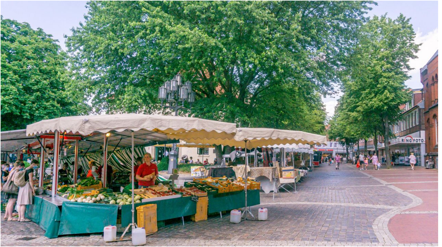
Wochenmarkt am Pferdemarkt