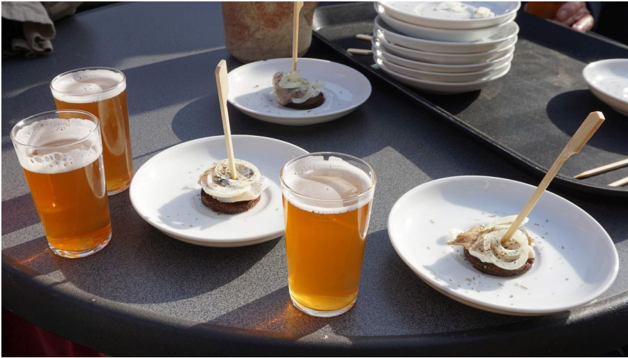
Buttert bei die Fische

Tradition, Brauchtum, Volksfest sonstige