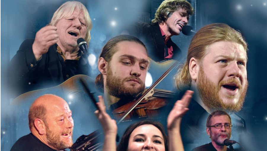
Zugschnittenes Plakat ohne Text.PNG