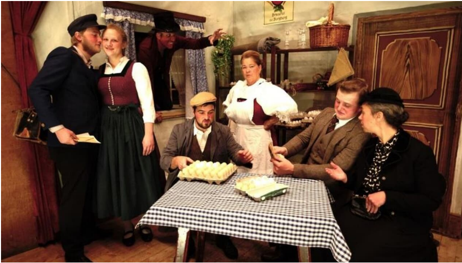
Mittenwalder Bauerntheater - "Der Deifi und die Kramerin" - Premiere!