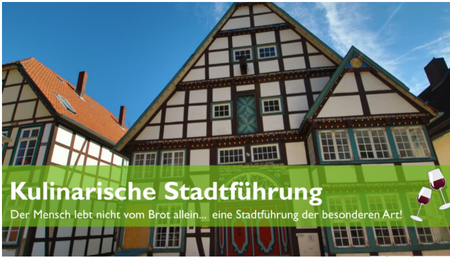
kulinarische Stadtführung