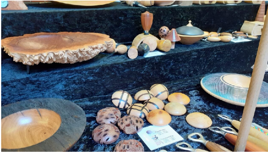
Kunst- und Hobbymarkt.png