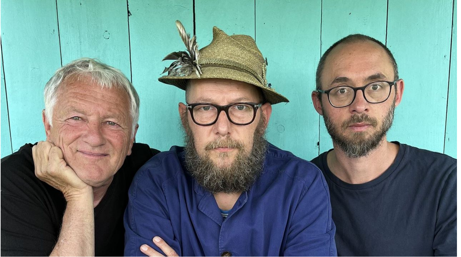
BSH Foto header