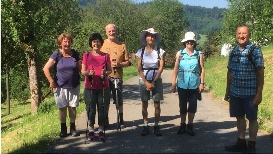
Schwarzwaldverein Achern