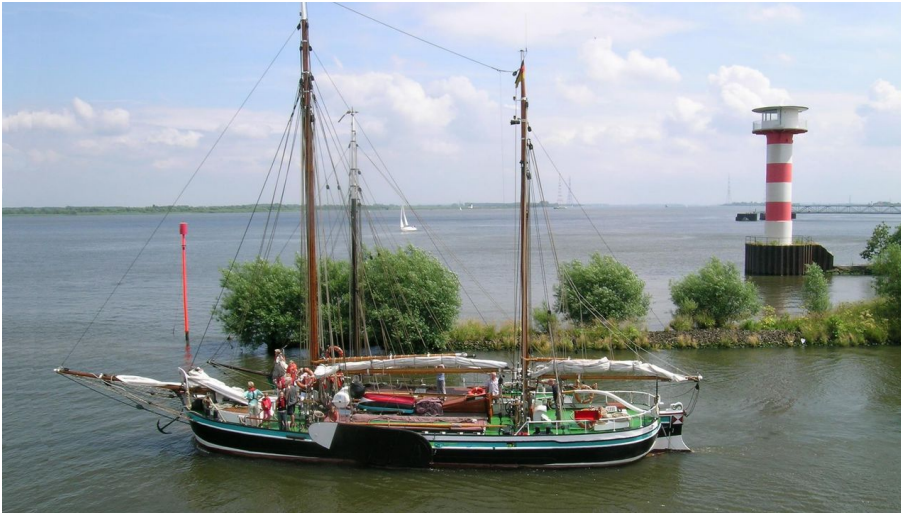
Wilhelmine von Stade